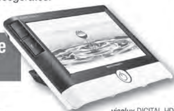
visolux DIGITAL HD Lesekomfort auf ganzer Linie

Mit zwei- bis 22-facher Vergrößerung und reflexionsfreiem 7-Zoll-Display steht visolux DIGITAL für besten Komfort. Sie erfasst eine ganze Zeitungsspalte, ohne dass sie seitlich verschoben werden muss, und bietet – an den Fernseher angeschlossen – die Funktionalität eines Bildschirmlesegerätes.